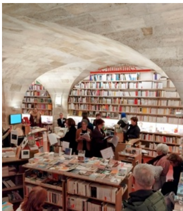
Les Nuits de la lecture -2024

À voix haute ou chuchotée, sous les voûtes de pierre, des Amis lecteurs de la Voix des Amis, passionnés de littérature, invitent les visiteurs à les écouter dire les extraits de leur choix d'auteurs italiens*.